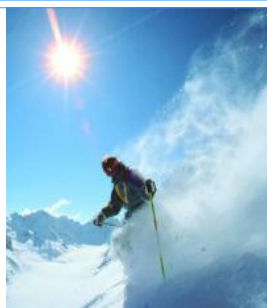
Il Meeting di Sci è uno dei più apprezzati dai soci

* partecipanti ad una o più iniziative nel corso dell'anno solare